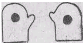
Рис. 1. Тренажер «Солнышко»

Тренажер применяется для детей с ясельного возраста, с успехом может быть применен в дошкольных группах детского сада.